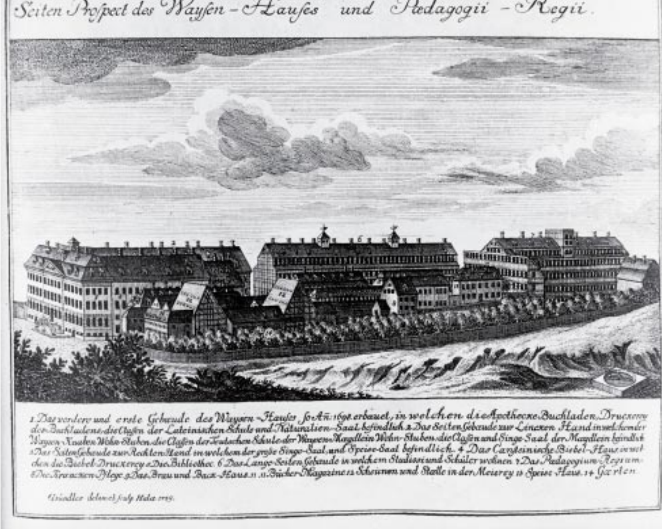
Zeitgenössischer Stich (Gründler 1719) mit Blick auf die Franckeschen Stiftungen von Süden her (Bestand des Archivs Franckesche Stiftungen: B:4197, C 19)

unterlag und sich nicht anders als im Geheimen zu entfalten vermochte (Dr. Holger Zaunstock).