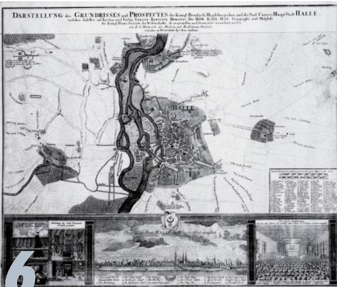
Karte von Halle und Umgebung mit drei Illustrationskupferstichen von Johann Christoph Homann, nach 1721 (Bestand der Zentralen Kustodie der Universität)

Phänomen Stadtgeschichte vorrangig die Geschichte der sozialen Ungleichheit anvisiert, die Untersuchung der sozialen Beziehungen, aus denen prägnante Faktoren einer detaillierten Sozialtopographie dieser Stadt abzuleiten wären. Alle am 1. Tag der hallischen Stadtgeschichte gehaltenen wissenschaftlichen Vorträge werden als Sammelband im Mitteldeutschen Verlag publiziert.