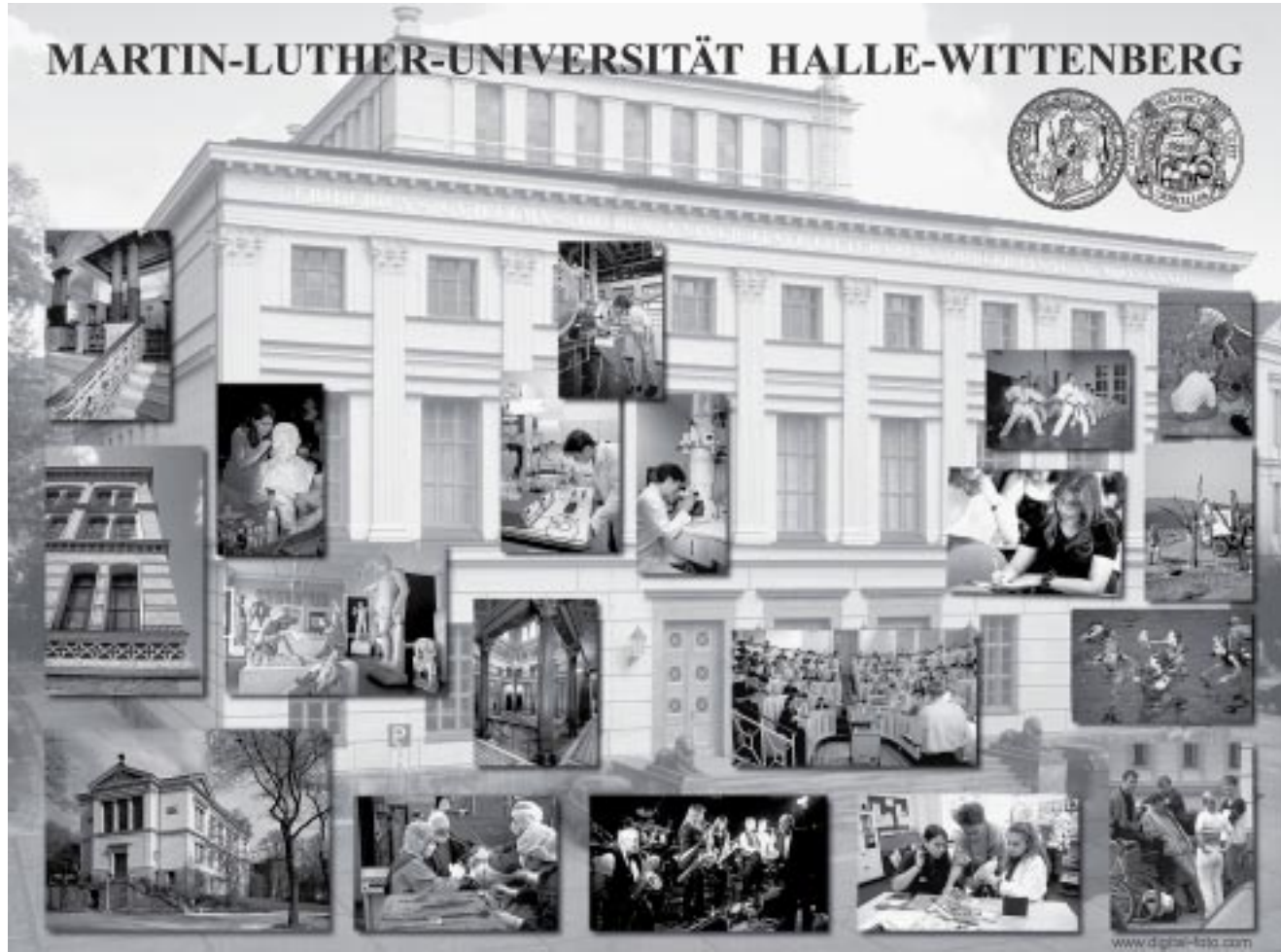
Attraktives Faltdisplay zeigte Magnetwirkung