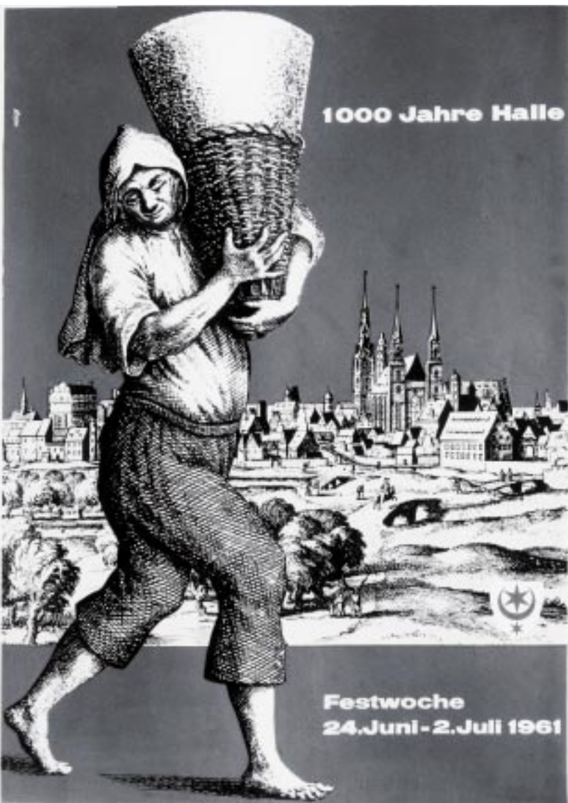
Plakat anlässlich der 1000-Jahr-Feier der Stadt Halle 1961 (Bestand des Stadtarchivs Halle,)