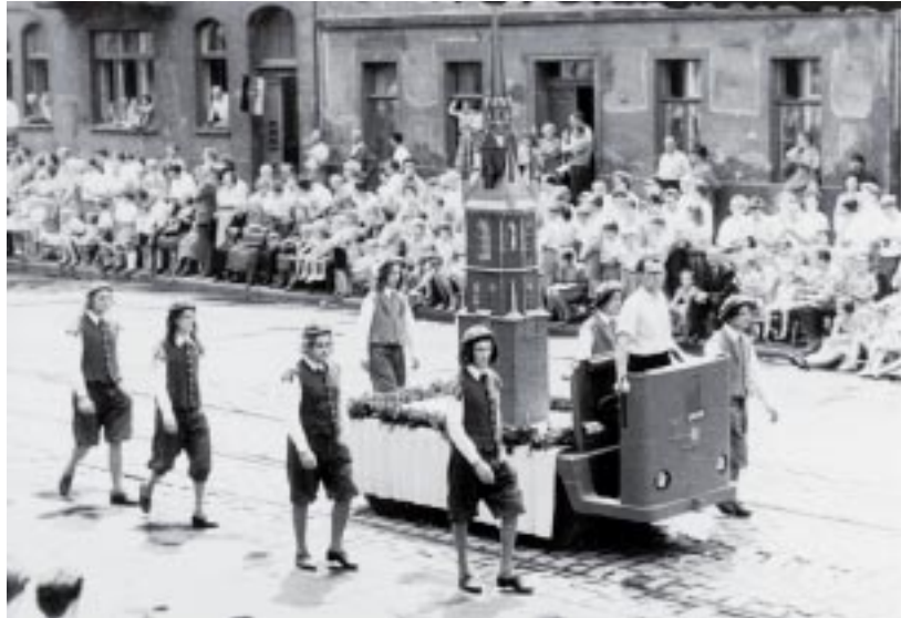
Ein Modell des Roten Turms beim Festumzug zur 1000-Jahr-Feier 1961