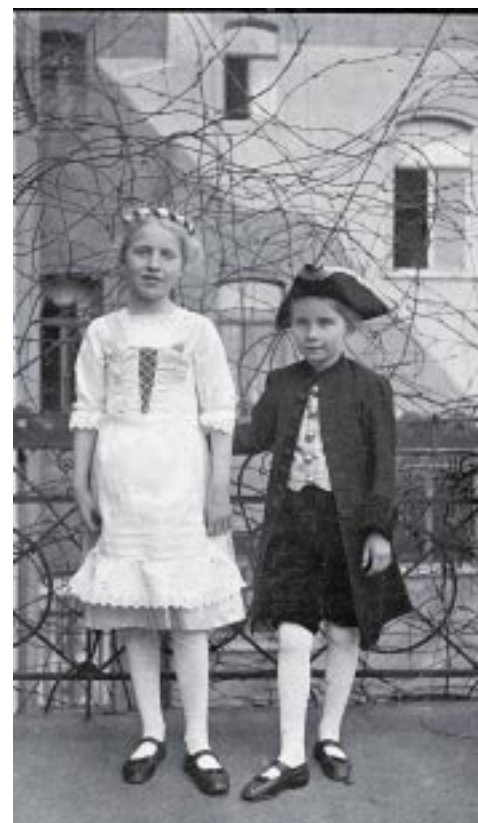
Privatfoto aus dem Jahr 1913: zwei hallische Kinder in den traditionellen Trachten der Halloren