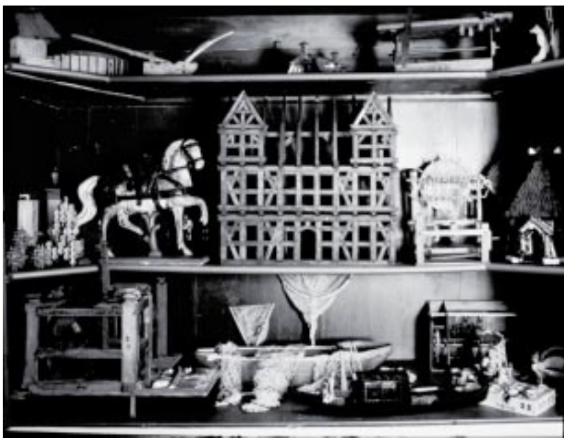
Blick in einen der Gebäudeschränke im Naturalienkabinett der Franckeschen Stiftungen